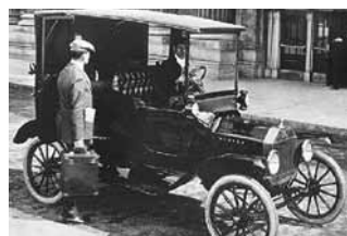
Wer seinen Fuhrpark least statt kauft, fährt immer die neuesten Modelle.

In Form einer stillen Beteiligung wird Eigenkapital für Unternehmen zur Verfügung gestellt.